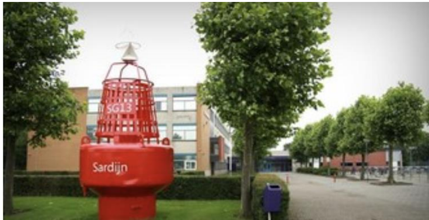
Bron 2: Locatie Sardijn – HAVO & VWO

Wat is de plaats van burgerschap in de school?