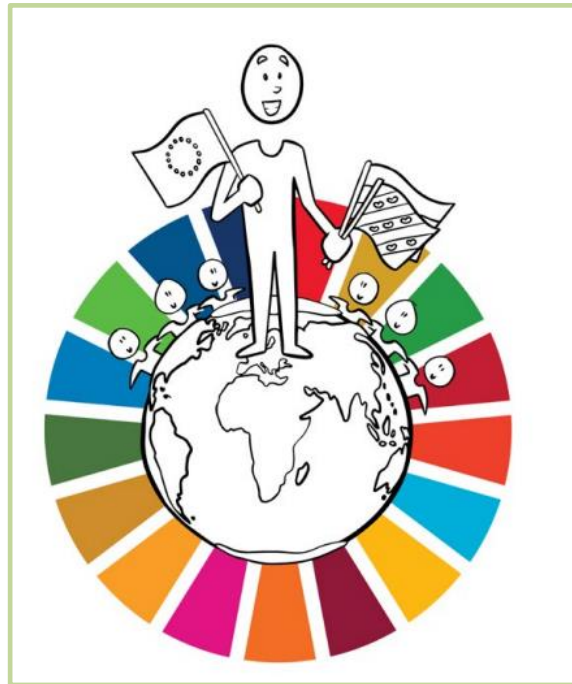
Bron 6: De Transformatieve School symboliseert de kracht van een inclusieve samenwerking

In bron 6 staat in het midden van de afbeelding een wereldbol met daarop mensen die hand in hand staan. Dit symboliseert de kracht van een inclusieve samenleving waarin verschillende individuen en groepen samenwerken, hun achtergrond, cultuur of vaardigheden vergroten. Leerlingen brengen een groot deel van hun jeugd door op een middelbare school, zoals Hadioui (2022) schrijft is school een ontmoetingsplaats waar leerlingen moeten leren samenleven.