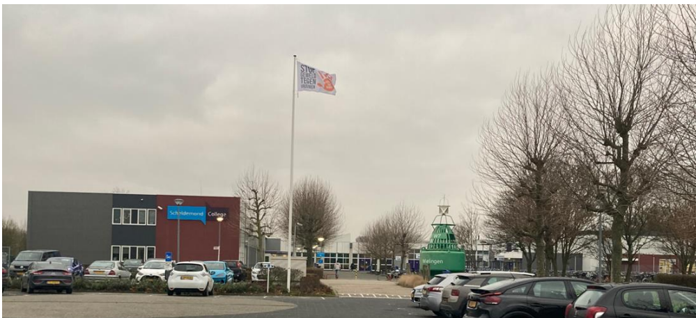
Bron 5 : Bouwsteen 6: Solidariteit – Stop geweld tegen vrouwen