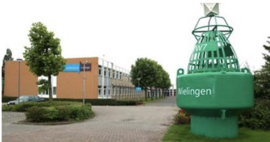
Bron 1: Locatie Wielingen - VMBO

Het Scheldemond College bestaat uit docenten, OBP of OOP'ers. Samen zij maken het verschil voor de leerlingen in de klas, of in het contact met een collega of een ouder.